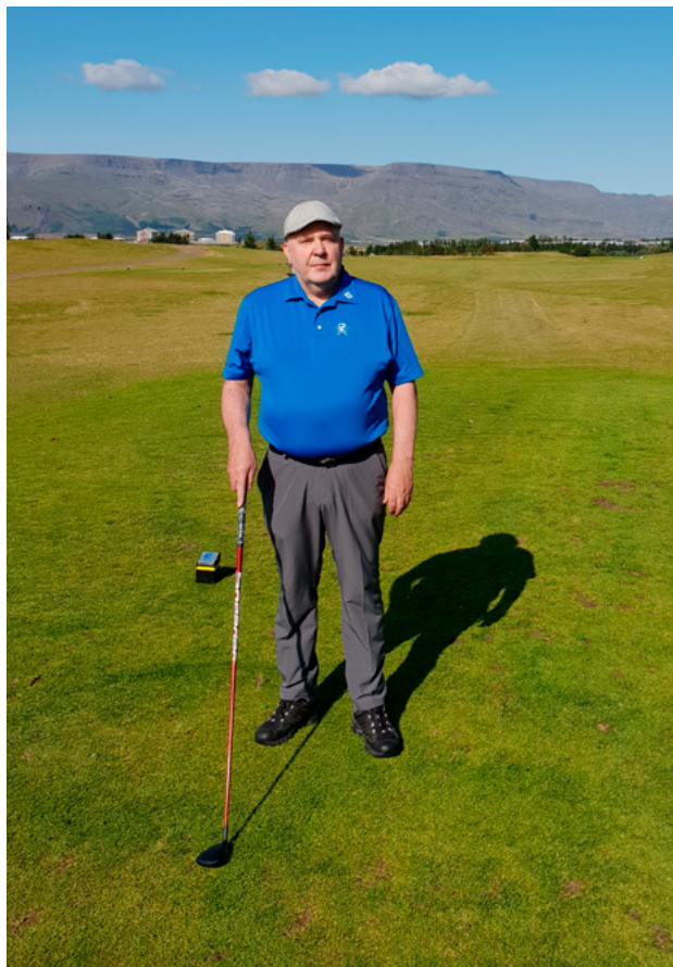
Næsta verkefni er golfið.

vinnan um að vernda viðkvæma hópa, tryggja réttindi félagsmanna og gæta hagsmuna félagsins og félagsmanna. Að lokum var 700 manns sagt upp í hópuppsögn og var það lang stærsta hópuppsögn landsins.“ Árið 2009 bættust svo sparisjóðirnir í hópinn, m.a. lokun SPRON.