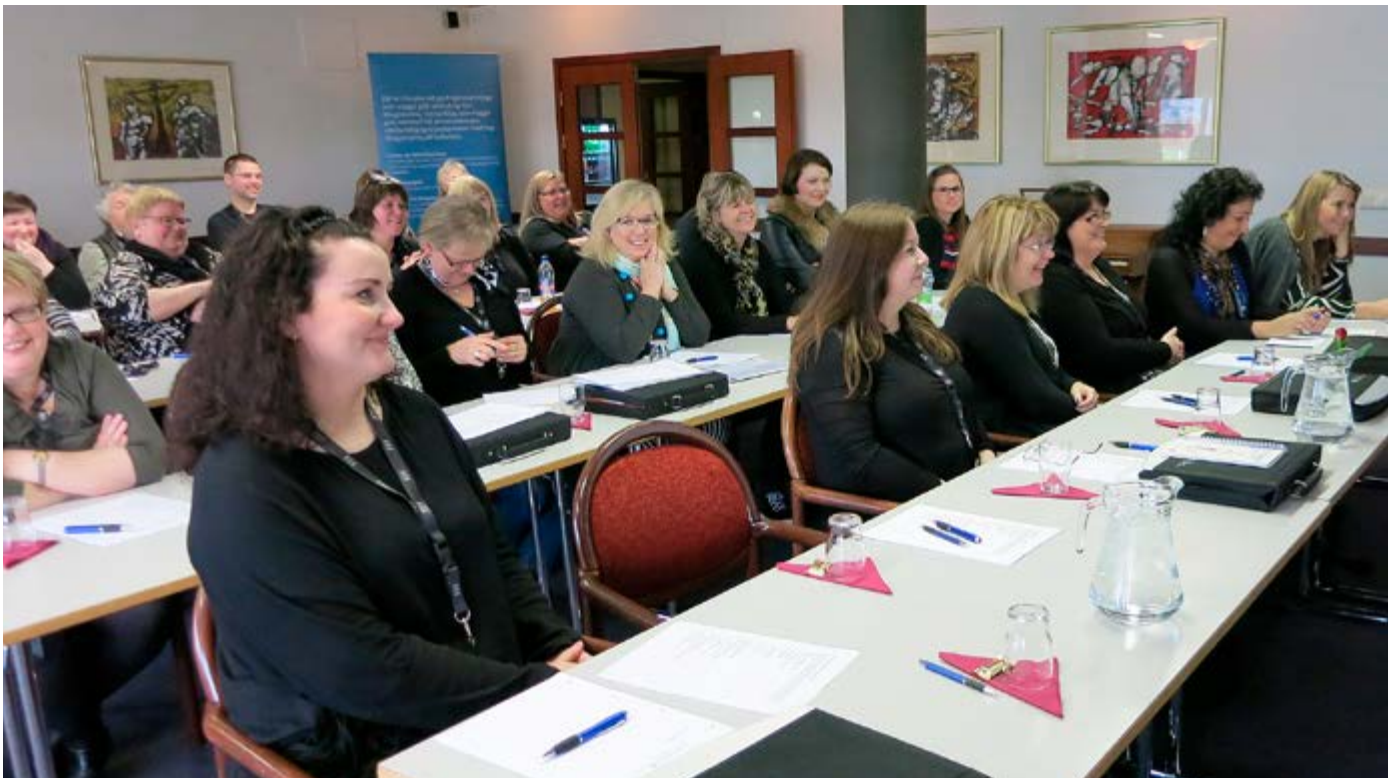
Trúnaðarmenn SSF telja námskeiðin gagnleg fyrir störf sín og hafa ánægju af þeim