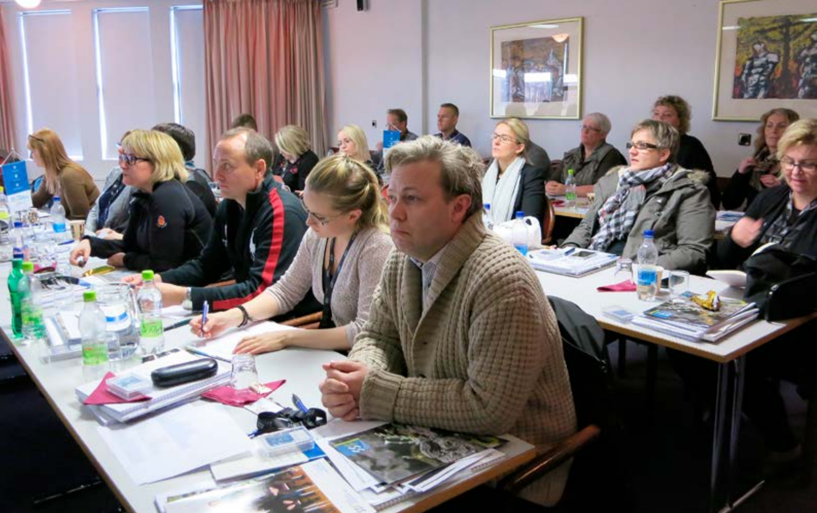
Fylgst grannt með þróun efnahagsmála.