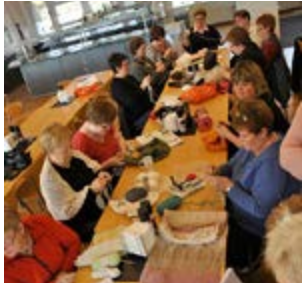
Handavinnuklúbburinn að störfum

Síðustu helgina í júní gekk um 30 manna hópur Laugaveginn frá Landmannalaugum að Þórsmörk. Ferðin heppnaðist einstaklega vel og hefur verið ákveðið að bjóða aftur uppá svipaða ferð á næsta ári þar sem færri komust að en vildu. Í haust voru líka gengnar tvær gamlar þjóðleiðir, Síldarmannagötur frá Hvalfirði að Skorradal í september og Selvogsgatan í október.