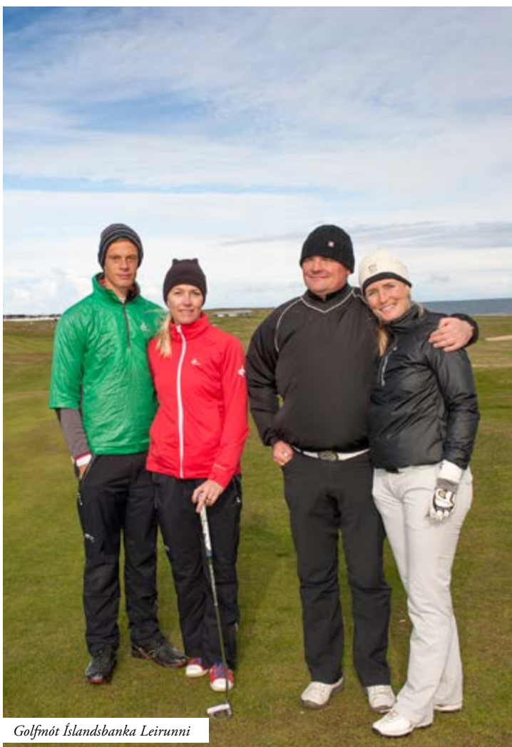
Golfmót Íslandsbanka Leirunni

Sumarmótin eru fjölbreytt og skemmtileg. Við byrjum árið jafnan á Texas Scramble móti þar sem óvanir sem vanir eru hvattir til að taka þátt. Svo koma tvö 18 holu mót þar sem keppt er í punktkeppni og fæstum höggum án forgjafar. Þessi mót eru opin öllum starfsmönnum Íslandsbanka ásamt mökum.