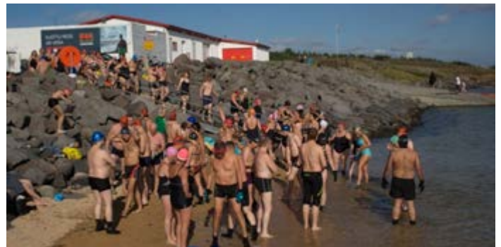
Ofurhugar sjósundsklúbbsins að búa sig undir sund í Nauthólsvík

SÍ hefur yfir að ráða 20 sumarhúsum og íbúðum á víð og dreif um landið. 14 eru á Suðurlandi, 4 á Norðurlandi, 1 á Austurlandi og 1 á Vestfjörðum. Hafa starfsmenn nýtt sér þessi húsnæði vel.